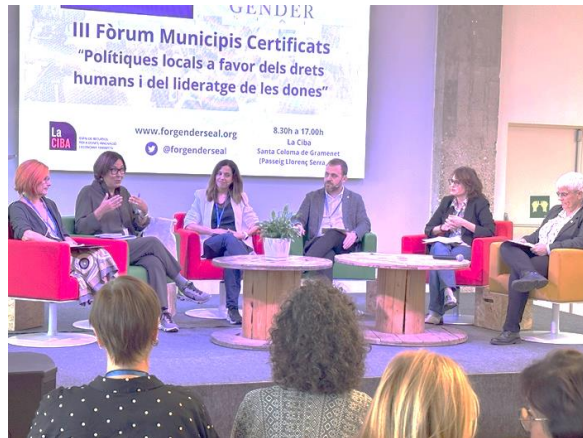
Taula Inaugural amb representants institucionals