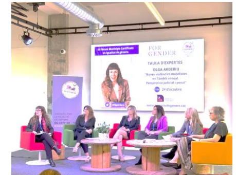
Taula d'expertes. "Enfocament de gènere per avançar en polítiques públiques"