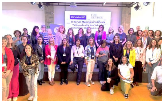
Foto de grup amb regidores, expertes i equips tècnics dels ajuntaments.