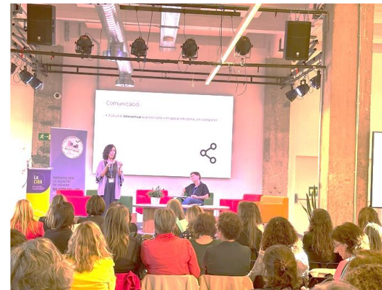
Conferència Inaugural sobre Comunicació Inclusiva