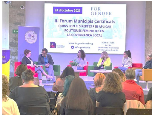
Taula "Reptes per aplicar polítiques feministes en la Governança Local"